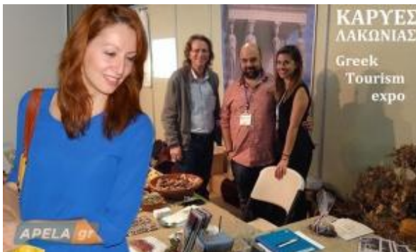
Το περίπτερο των Καρυών.

Οι επαγγελματίες και οι Σύλλογοι του χωριού κινητοποιήθηκαν και έτσι ο όμορφος τόπος μας, οι ΚΑΡΥΕΣ , συμμετείχαν με δικό τους περίπτερο στην έκθεση. Αρκετοί ήταν οι συμπατριώτες που ανταποκρίθηκαν στην πρόσκληση του Συνδέσμου και το επισκέφτηκαν μαζί με φίλους τους, για να τους γνωρίσουν το όμορφο χωριό και να απολαύσουν τα τοπικά προϊόντα .