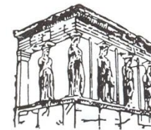
ΣΥΝΔΕΣΜΟΣ ΤΩΝ ΑΠΑΝΤΑΧΟΥ ΚΑΡΥΑΤΩΝ

Αν και οι χριστουγεννιάτικες διακοπές θεωρούνται «γιορτή της πόλης», δεν έλειψαν από το χωριό οι εκδηλώσεις. Πιο συγκεκριμένα στις 24 Δεκεμβρίου, παραμονή των Χριστουγέννων, στις 11.00 το πρωί, τα μέλη του «Λακωνικού Ωδείου» τραγούδησαν παραδοσιακά κάλαντα, ενώ το βράδυ στις 26 Δεκεμβρίου διοργανώθηκε μουσική βραδιά στα «Αραχωβίτικα Καλύβια».